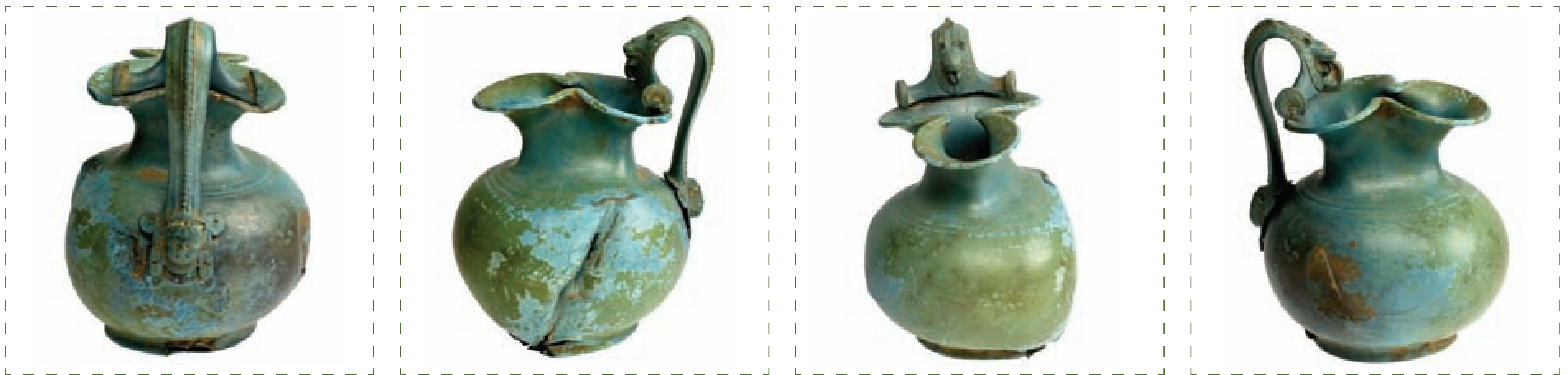
Stanje predmeta prije restauratorsko-konzervatorskog postupka

Predmet se sastoji od dva dijela: vrča i drške koja je raskošno ukrašena motivom ljudske glave na donjem i lavlje na gornjem dijelu. Predmet je recentno ireverzibilno oštećen u području trbuha vrča. Čvrst i kompaktan originalni sloj je sačuvan na većini površine predmeta.